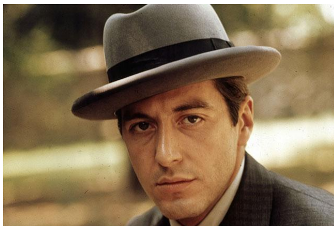
Figura 1.6: Al Pacino nei panni di Micheal Corleone ne Il Padrino II nel 1974 Coppola, che stava preparandosi a girare Il padrino , s'impuntò con la produzione per volerlo nei panni di Michael Corleone. Sarà proprio questo film del 1972 a lanciare Al Pacino tra le star di Hollywood, valendogli una doppia nomination ai Golden Globe e

Lo statunitense Alfredo James Pacino, conosciuto semplicemente come Al Pacino, è un attore, sceneggiatore, regista e produttore. È nato il 25 aprile 1940 a Manhattan da una famiglia di origini siciliane: la madre era casalinga, il padre un venditore porta a porta che abbandonò la famiglia quando Al Pacino aveva solo 2 anni, costringendo lui e la madre a trasferirsi a casa dei nonni materni nel South Bronx in condizioni di estrema povertà. Il giovane Al non era fatto per studiare: vive gli anni dell'adolescenza in maniera scapestrata, tra fumo, alcol e risse scolastiche. In un primo tempo coltiva la sua passione per il baseball, poi, a 17 anni, decide di lasciare la scuola per diventare un attore. La madre non lo sostiene, sicché Al Pacino si guadagnerà da vivere svolgendo diversi lavoretti. Cerca di entrare all'Actor's Studio, ma viene rifiutato; imperterrito, continua a studiare recitazione in altre accademie fin quando, all'età di 30 anni, ritenta con successo. L'attore approda sul grande schermo in un piccolo ruolo in un film del 1969, Me, Natalie , mentre nel 1971 ottiene la sua prima parte da protagonista in Panico a Needle Park , in cui interpreta un giovane eroinomane. Fu proprio questa interpretazione ad aver attirato l'attenzione di Francis Ford Coppola.