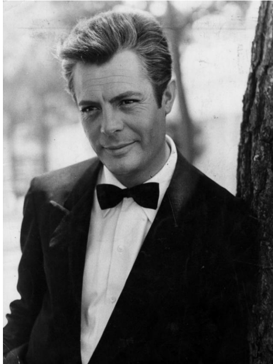
Figura 2.5 Marcello Mastroianni

La sua carriera fu lunghissima; interpretò ben 160 pellicole con i più grandi registri del tempo, ma raggiunse l'apice del successo grazie a Federico Fellini che lo definì come il suo "alter ego", soprattutto rispetto a due film che lo resero un divo di fama internazionale: La dolce vita , del 1960, e 8½ , del 1963.