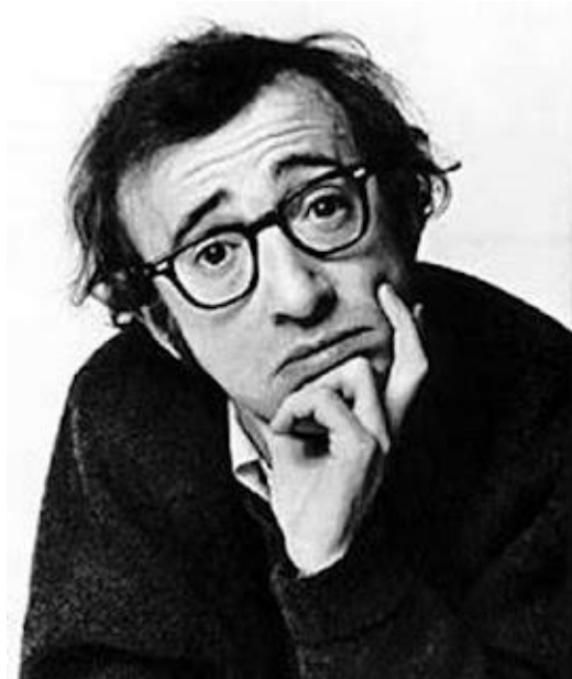
Figura 2.6 Woody Allen

Il regista, attore e sceneggiatore Woody Allen, nome d'arte di Allan Stewart Konigsberg, è uno dei più celebri umoristi contemporanei, ed è considerato “il più europeo” tra i registi statunitensi per il modo profondo e irriverente con cui affronta certe tematiche spinose.