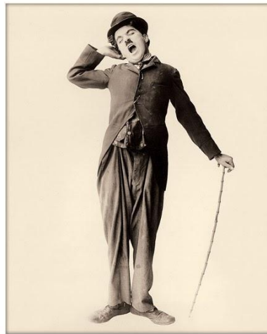
Figura 2.4: Charlie Chaplin nella maschera di Charlot

Nato a Londra nel 1889, l'attore comico e regista Charles Spencer Chaplin, noto a tutti come Charlie Chaplin, è stato una delle personalità più rappresentative del cinema di tutti i tempi, non solo muto. Visti i suoi oltre settanta anni di carriera, le sue produzioni furono varie, di volta in volta influenzate dagli avvenimenti storici e dalle continue innovazioni culturali e tecnologiche dei tempi.